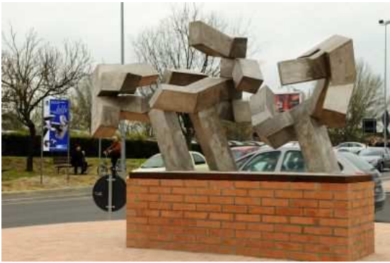
LE TRE GRAZIE (2009) dello scultore volterrano Dolfo (Volterra, 1937); Ubicazione: rotatoria via Veneto - via T. Romagnola.

La scelta del metallo, come elemento centrale nella costruzione scultorea, rimanda ad un elemento di durezza della realtà. Le forme contorte delle sculture, sembrano indicare un segno di rivolta, un grido di allarme, per una civiltà incapace di ascoltare e crescere