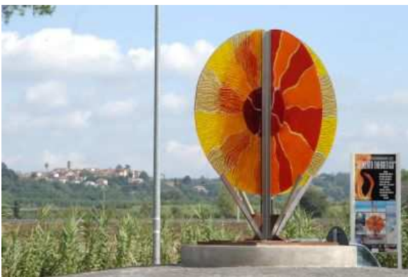
ELEMENTO ENERGETICO (2009) di Massimiliano Luzzi (Roma 1969); Ubicazione: rotatoria via V. Veneto. In cristallo forgiato e acciaio. Luzzi plasma il vetro illuminandolo di colore, realizzando creazioni uniche che si ispirano “alla bellezza e alla perfezione della Natura, al suo equilibrio, alla sua forza, ricche di colori ed energie, che cercano di stupire ed emozionare usando come tramite questa Materia così unica e affascinante, che nasce dal lavoro costante dei

mari, dei fiumi, del vento: il vetro. Materia estremamente mutevole prima solida poi liquida e poi ancora solida, può assumere mille forme, diventare messaggio, espressione di un'anima, un filtro di luce, un'opera d'arte”.