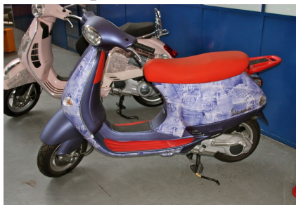
La Vespa dipinta da Ugo Nespolo