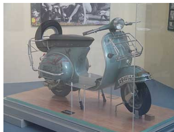
Una Vespa Jeans

Questa Vespa venne realizzata e firmata da Salvador D'Alì nel 1962.